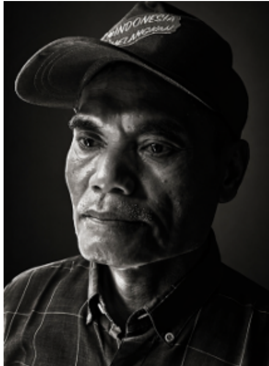
Gambar 4. karya Lucky Farida, Foto potret

Hasil foto potret karya Lucky Farida menggunakan cahaya tidak langsung yang menyinari wajah ayahnya sebagai model, adapun tipe jenis kulit yang berminyak. Sehingga terlihat adanya rentang zona tengah (abu-abu) yang panjang dapat dilihat pada karya Lucky Farida ini. Tona kulit, yang dimaksud adalah kualitas kecerahan yang ditunjukkan oleh tone gradien . Hal yang penting diperhatikan adalah kenali subjek yang difoto dan tentunya kecerahan dari skin tone model tersebut. Fotografer dengan mudah mengenalinya dan merasakan warna kulitnya meskipun dalam citra hitam-putih (Freeman, 2010).