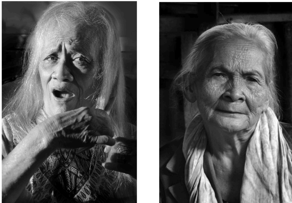
Gambar 3. model 1(kiri), dan model 2 (kanan)

Model 1 bentuk wajah yang lebih memanjang (lonjong) dengan kulit yang lebih halus. Tekstur kerutan hanya di bagian kening di antara kedua mata model. Wajah lebih kurus, tulang pipi lebih menonjol. Model 2 memiliki bentuk wajah yang lebih bulat, dan lebar ke samping. Wajah terlihat persegi dengan tulang dagu bulat dan sudut pipi bagian bawah hampir terlihat persegi. Wajah lebih bertekstur dengan kerutan yang cukup banyak.