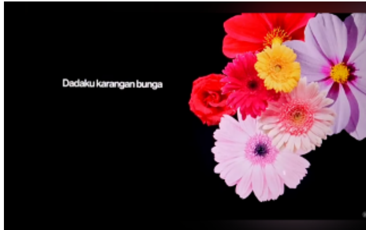
Gambar 6. Video Lirik Bagian "Dadaku karangan bunga"

Dalam konteks multimodal, warna bekerja bersama tipografi dan gerak visual untuk menciptakan atmosfer yang konsisten. Interaksi ini membuat makna tidak hanya muncul dari satu elemen, tetapi dari keseluruhan komposisi visual yang saling mendukung (Jewitt, 2016).