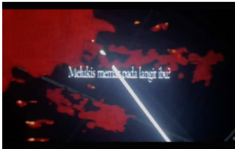
Gambar 5. Video Lirik Bagian “Melukis memar pada langit ibu?”

Dominasi warna gelap, kontras tinggi, serta tekstur kasar membangun atmosfer emosional yang muram dan menekan. Video lirik tidak menampilkan kekerasan secara eksplisit, melainkan menghadirkan sensasi luka batin melalui visual yang implisit. Metafora “memar” diterjemahkan secara visual melalui bayangan, noise, dan distorsi, menegaskan bahwa luka emosional sering kali tidak tampak secara kasat mata namun tetap membekas.