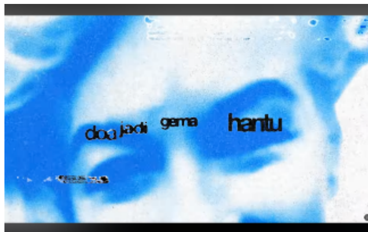
Gambar 3. Video Lirik Bagian “Doa jadi gema hantu”

Dalam pendekatan multimodal, lirik tidak berdiri sendiri, tetapi diperkuat oleh elemen visual yang menyertainya. Kemunculan teks yang sinkron dengan perubahan musik serta didukung oleh visual gelap menciptakan hubungan yang erat antara makna verbal dan visual, sehingga memperdalam pengalaman emosional audiens (Jewitt, 2016).