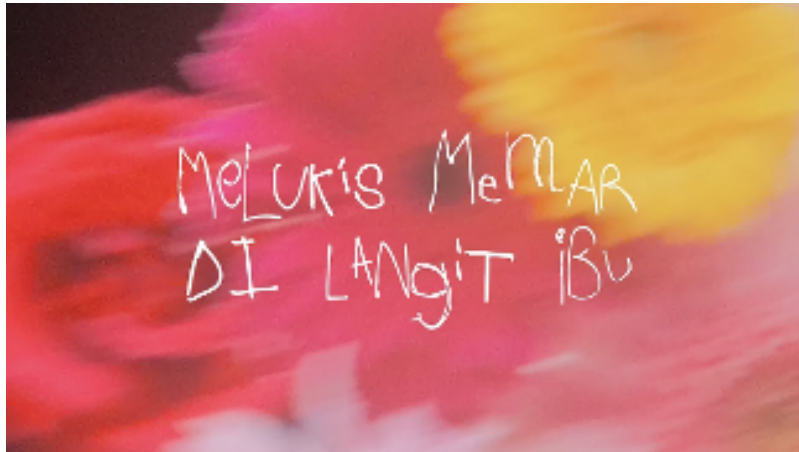
Gambar 1. Cover Video Lirik “Rekah - Melukis Memar Di Langit Ibu”