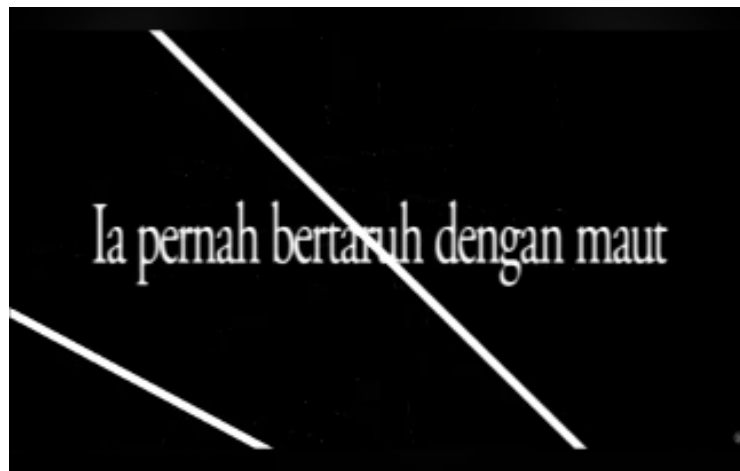
Gambar 2. Video Lirik Bagian “Ia pernah bertaruh dengan maut”

Lirik berfungsi sebagai inti narasi emosional dalam video lirik ini. Kalimat seperti “Ia pernah bertaruh dengan maut” secara konotatif membangun rasa genting dan ketakutan, yang mengarahkan audiens pada pengalaman ekstrem penyintas kekerasan berbasis gender. Ketidakjelasan subjek dalam lirik membuka ruang empati, sehingga pesan emosional tidak bersifat personal semata, tetapi dapat dibaca sebagai pengalaman kolektif.